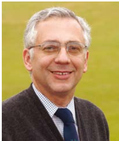
POR RICARDO CRESPO

“Especialmente para mi generación –él era dieciséis años mayor que yo– fue un héroe mucho antes de lograr verdadera fama como teórico de economía. ¿No era el hombre que había tenido el coraje de pronunciarse en contra de las cláusulas económicas de los tratados de paz de 1919? Admirábamos sus libros brillantemente escritos