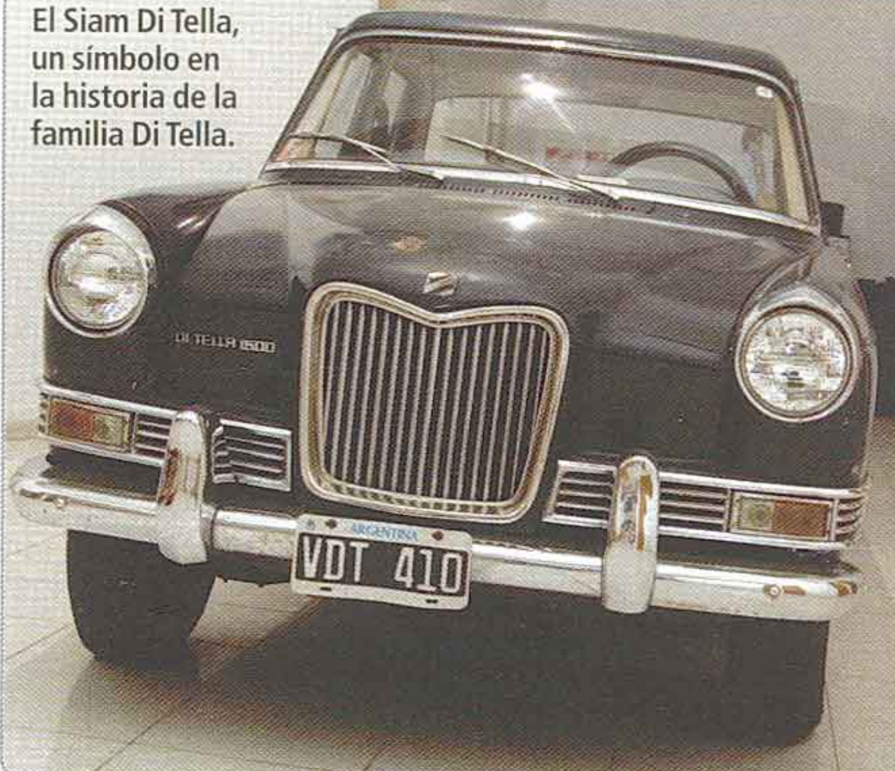
El Siam Di Tella, un símbolo en la historia de la familia Di Tella.