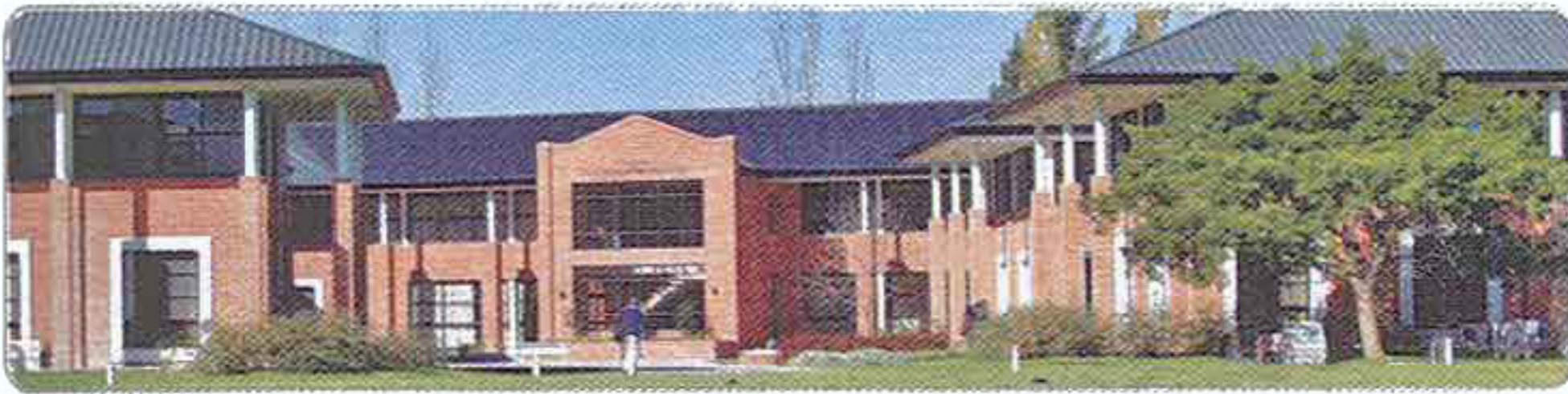
Alumnos de la UdeSA en Victoria.