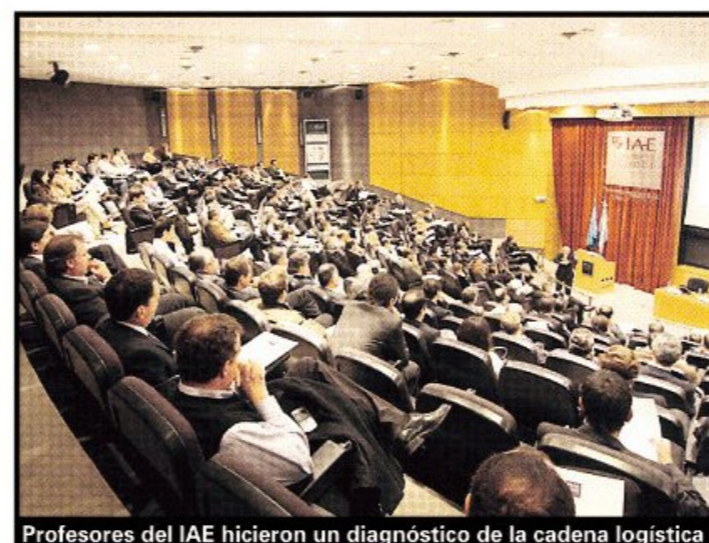
Profesores del IAE hicieron un diagnóstico de la cadena logística

rol del área del supply chain dentro de las propias organizaciones y en el conjunto de la sociedad, en cuanto es clave para el desarrollo de la competitividad. A partir de los datos de la encuesta, sumado a lo trabajado en los talleres, que está siendo procesado por el equipo de docentes del IAE, surgirá un diagnóstico detallado que se conocerá el próximo 25 de noviembre en La Rural, en el marco de Expo Transporte y el do-