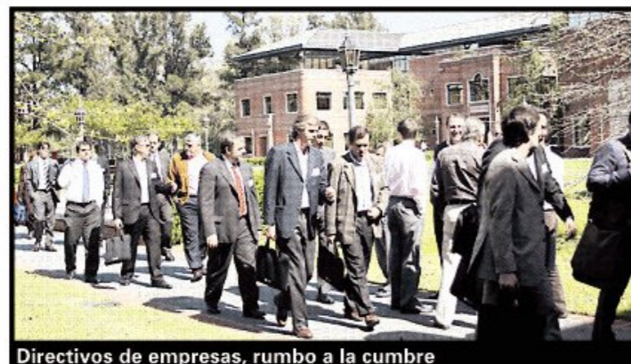
Directivos de empresas, rumbo a la cumbre

De ese sondeo, que fue completado por cerca de 200 referentes del sector y luego analizado por los académicos del IAE Business School, surgieron cuáles son los puntos más acuciantes en distintas dimensiones, como infraestructura y entorno, integración interna, integración con clientes y proveedores, outsourcing e internacionalización, sobre las que se trabajó en talleres presenciales. ■ Mejorar el sistema de transporte ferroviario y de carreteras resultó prioritario para el 60% de los empresarios encuestados, quienes puntualizaron entre los problemas más graves, los tiempos de tránsito excesivo ocasionados por cortes de