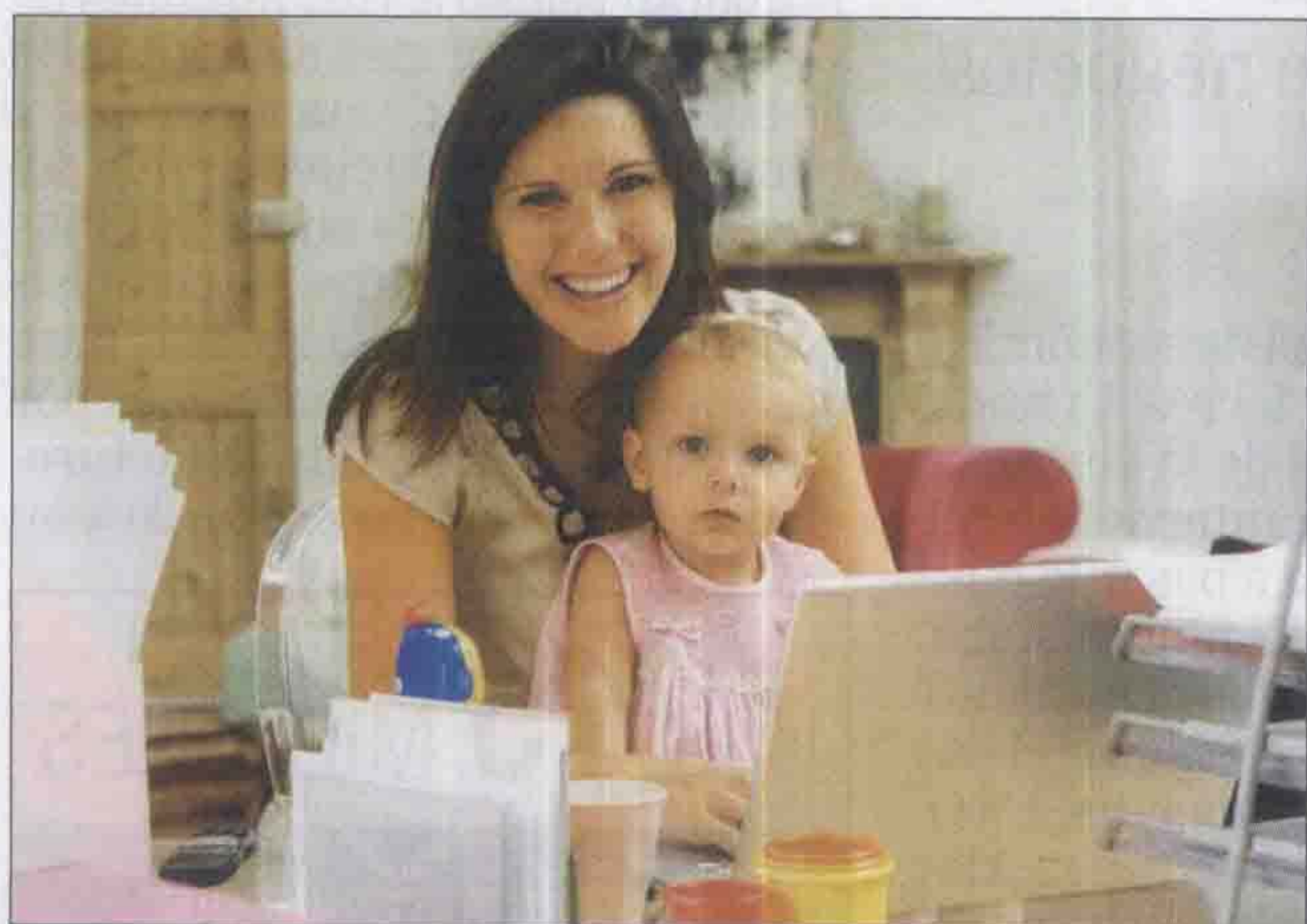
MATERNIDAD. En Coca-Cola, las madres trabajan tantas horas como meses tiene su hijo. A los ocho meses se reincorporan plenamente.

En Coca-Cola las empleadas que toman licencia por maternidad se reincorporan a los cuatro meses de vida del hijo, y en forma progresiva hasta que el bebé cumple ocho meses. Se trabaja tantas horas como meses tiene el hijo, por eso a los ocho meses la reincorporación ya es plena. Esta política, que forma parte de las acciones de Life Balance de la compañía, responde a que las mujeres de la empresa quieren reincorporarse al empleo después de tener hijos, pero desean hacerlo progresivamente. En la misma empresa también se le paga a los em-