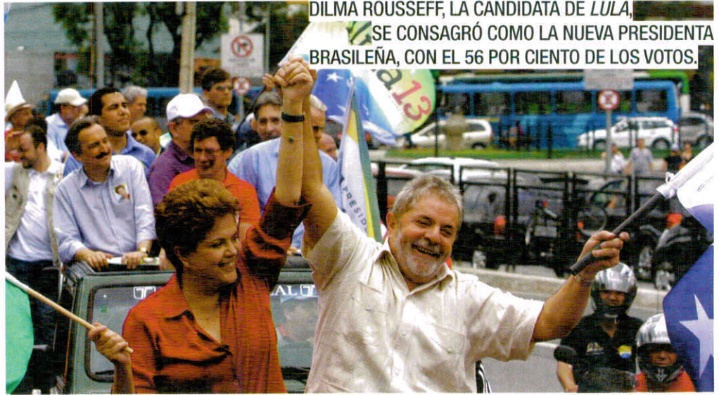
DILMA ROUSSEFF, LA CANDIDATA DE LULA, SE CONSAGRÓ COMO LA NUEVA PRESIDENTA BRASILEÑA, CON EL 56 POR CIENTO DE LOS VOTOS.

los objetivos, pero ello podría ayudar a hallar una solución regional”.